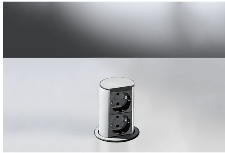
Casper 8000 014